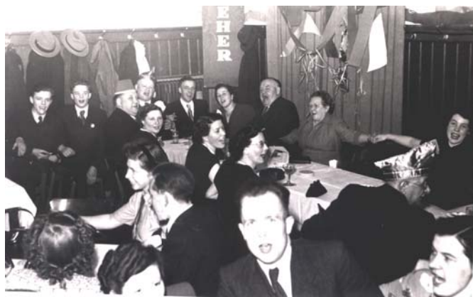
Bürgermeister Anton Minnebusch (hinten Mitte) schunkelt 1953 fröhlich mit!

Erst 1947 trafen sich in Reckenfeld die Mitglieder der katholischen Kirchengemeinde und feierten Karneval. Dieses Datum steht als Gründungsdatum für den „Karneval der kirchlichen Vereine – Ka-Ki-V“. Ein Jahr später gründete sich ebenfalls in Reckenfeld die Reckenfelder Carnevalsgesellschaft „Re-Ka-Ge“. Bis 1955 mussten die Grevener auf die Gründung einer eigenen Carnevalsgesellschaft warten. Unter dem Namen „KG Emspünte“ schlossen sich in der Stadt die Narren zusammen und feiern im Jahr 2005 ihr 50-jähriges Bestehen. Was für die Amtmänner des Amtes Greven vor über 110 Jahren undenkbar war, fiel in den Fünfzigerjahren den Bürgermeistern nicht mehr schwer.