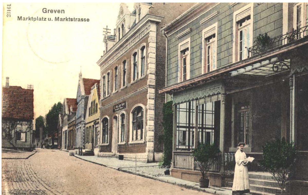
Marktstraße mit Hotel Niemann (rechts), 1907

Dort wurde der Ablauf des Umzuges genau geschildert. Der Umzug durchs Dorf startete Rosenmontag nachmittags um 2 Uhr. Die „Kappenfahrt“ wurde von einer Musikkapelle angeführt. Daran schlossen sich die Masken zu Pferde und zu Wagen an. Ausgangspunkt der „Kappenfahrt“ war das Hotel Niemann.