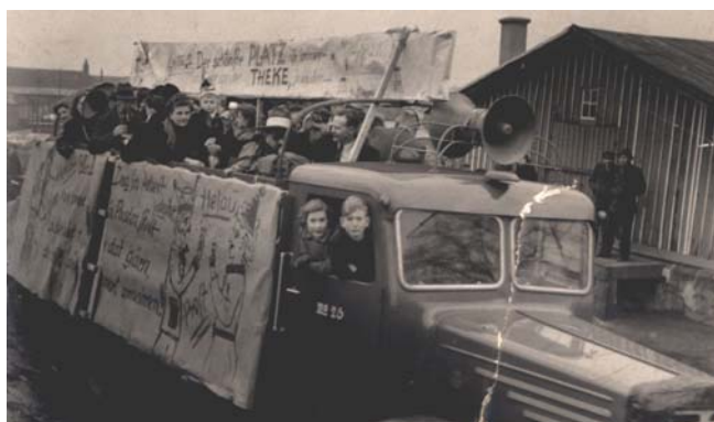
Karnevalsumzug des Schützenvereins Bahnhof, 1952

Der erste Karnevalsumzug nach dem II. Weltkrieg fand 1952 statt. In diesem Jahr beschloss der Schützenverein Bahnhof einen Umzug durchzuführen. Im Jahr darauf führte der erste offizielle Karnevalsumzug durch die Stadt.